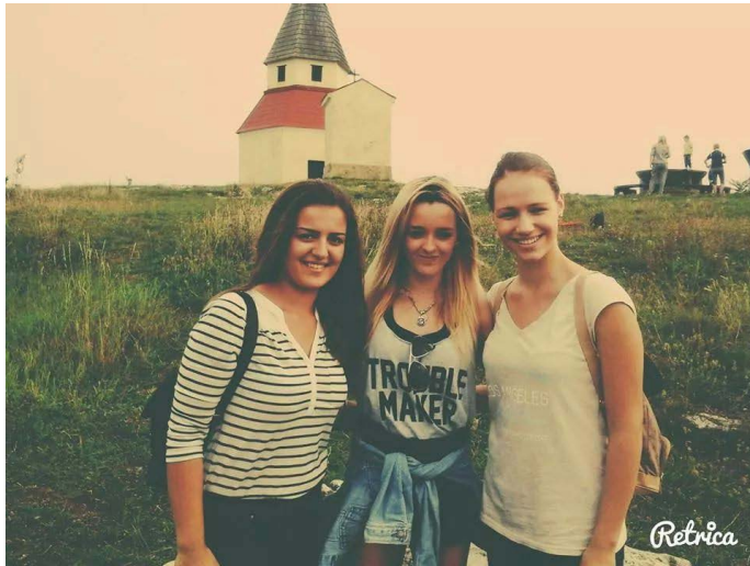
con unas amigas...

Las primeras semanas sí puedo decir que eché mucho de menos a mi familia, fue durísimo incluso las tres primeras noches fueron terribles. Ahora sí, también extraño mi familia, mis amigos y costumbres, pero no es tan duro como al principio porque día a día me acostumbro un poco más, y mi familia de acogida me ayuda mucho y me contiene, pero estoy realmente feliz de estar aquí. Creo que un año está bien, no quiero quedarme menos ni más tiempo que un año, es suficiente y si algún día podría regresar con familia me encantaría.