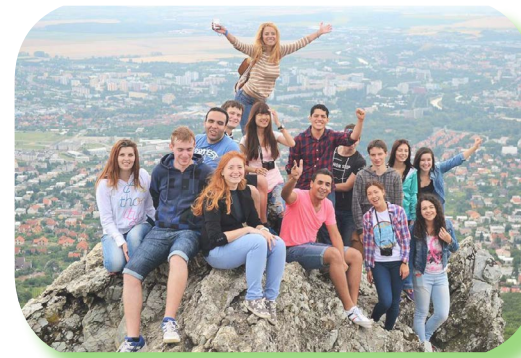
Con unos amigos en Zobor

“¡Sepa la bola!” quiere decir “no lo sé”.